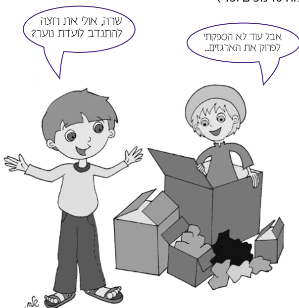
שלב הגיבוש מתאים לשילוב מעשי בתפקידים ביישוב